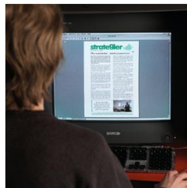
Strategier finns också som digital pdf-fil, 22 nr för endast 2450 kr per år med spridningsrätt för upp till 50 datorer.