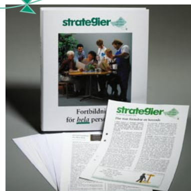
Vår produkt, Strategier , i sin ursprungliga pappersutgåva, 22 nr för endast 1450 kr per år med vår unika kopieringsrätt.

Rigmor Ödman, Personalkontoret, Jönköpings kommun